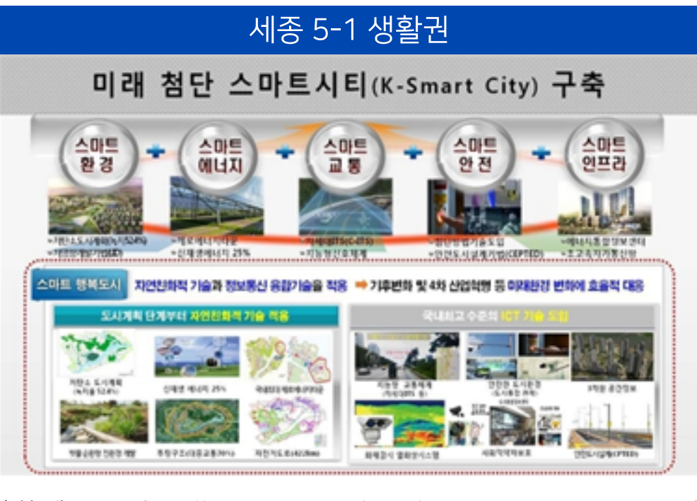
출처: 세종포스트( http://www.spost.co.kr/news/articleView.html?dxno=14736 )